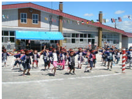
中央保育所の運動会の様子