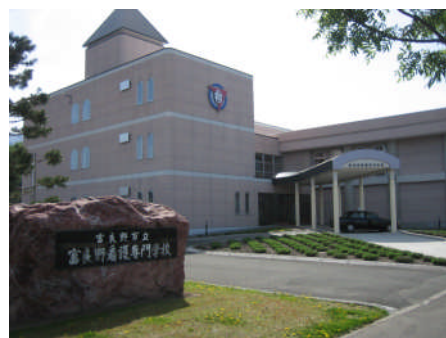
富良野看護専門学校校舎

今後の高齢化社会を支える医療の現場に一人でも多くの看護師を送り出せるよう教職員一同、熱意と情熱をもって効果的な教育活動を展開いたします。